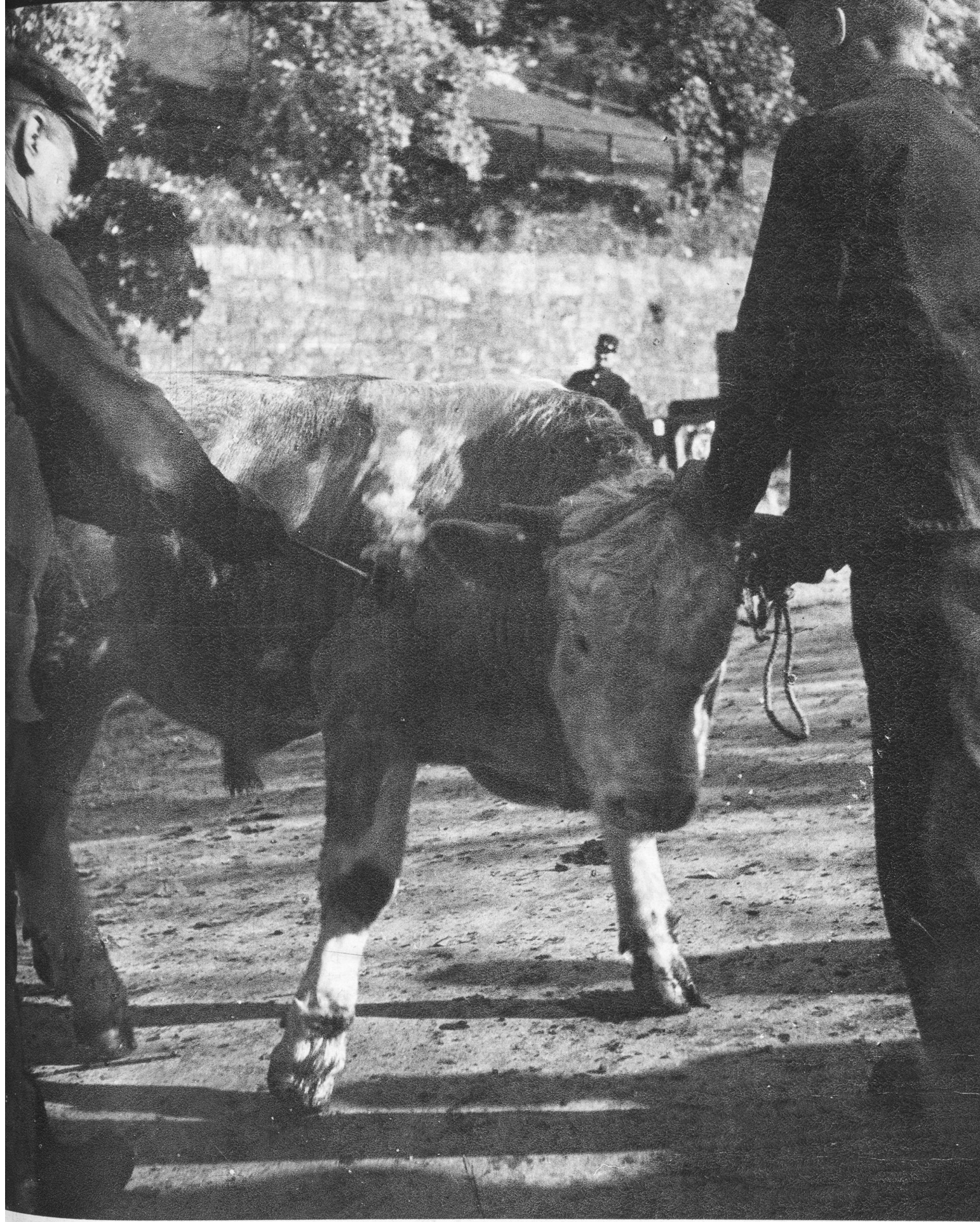
Die Viehschau in der Bundesstadt. Mit dem Brandeisen wird er mit dem Buchstaben A zur Zucht anerkannt. — Siehe Bildbericht in dieser Nr.