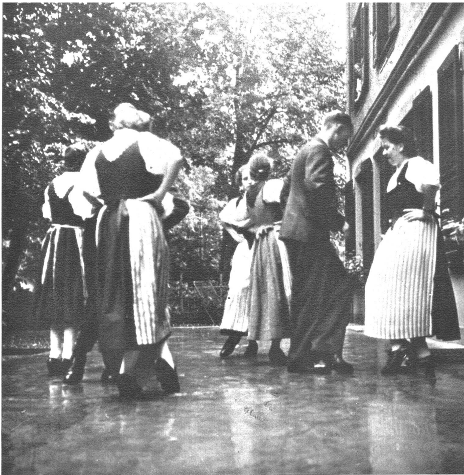
Fleissig werden die alten Volkstänze geübt