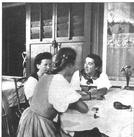
Zwischen den Tänzen findet man Zeit zu einem Plauderstündchen.