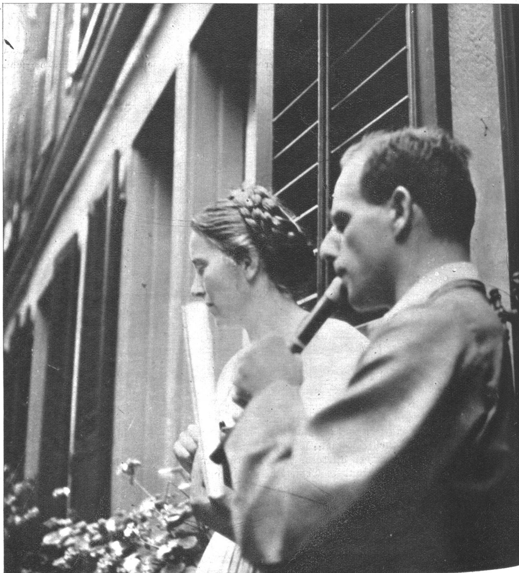
Zu den Klängen heimatlicher Musik wurde getanzt.