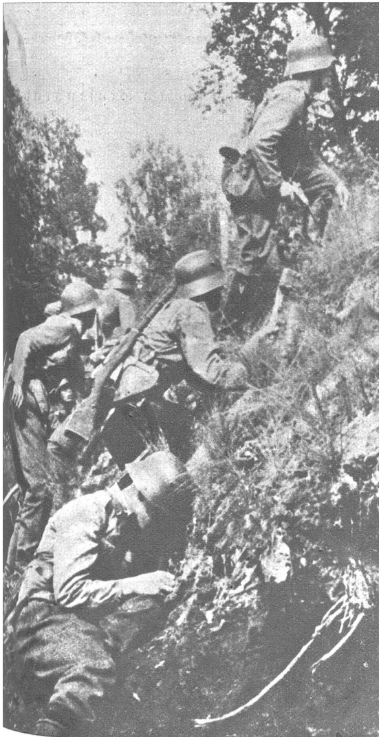
Die deutschen Truppen liegen immer noch im Angriff, doch beginnen sich die erlittenen Verluste fühlbar zu machen.