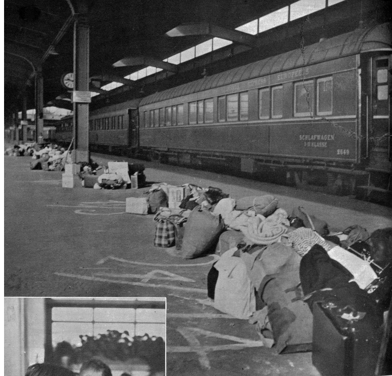
Noch vor dem Eintreffen der Kinder am Bahnhof stehen Koffer und Packli zum Einladen bereit.