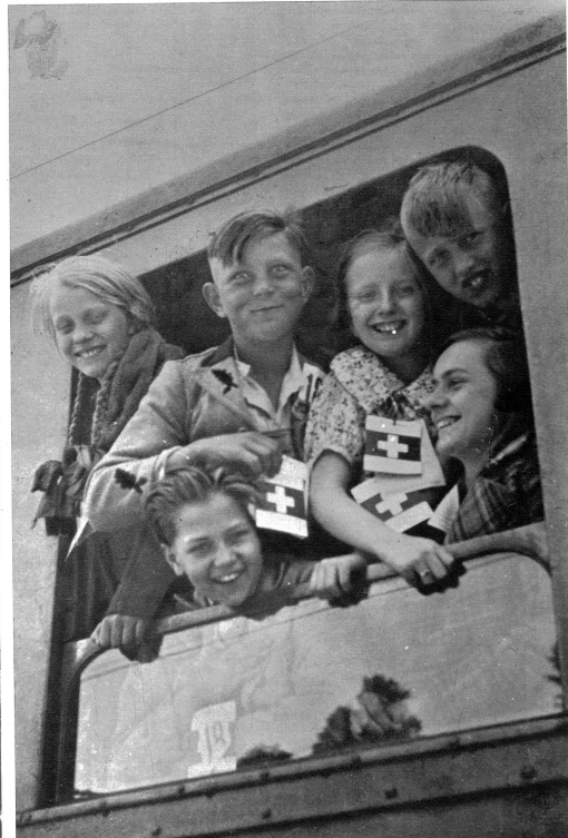
Nicht nur Glück, auch neue Kraft nehmen diese Kinder nach Hause mit.