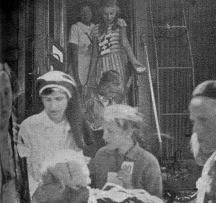
Die Begleiterinnen sorgen für die richtige Überstellung im Waggon.