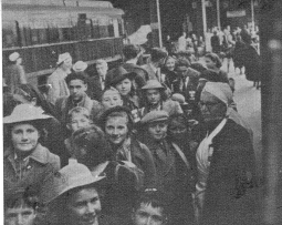
Jede Begleiterin hat für ihre eigene Gruppe zu sorgen und zu beachten, dass die Zahl ihrer Pfinglinge beisammen bleibt.