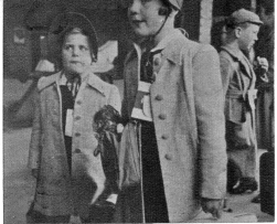
Mit vollen Backen und der Erkennungsnummer kommen die Kinder zum Bahnhof, um die Heimreise anzutreten.