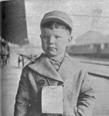
Die Bäckli sind wieder rund; das Hilfswerk hat in den kleinen glücklichen Menschen die Liebe voll zum Ausdruck gebracht. — Der Abschied ist schwer, obschon der Weg heimwärts führt.