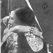
Das Herz ist immer mit dabei; wo es zu scheiden geht, muss das kleine Herzchen übergeben . . .