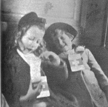
Auf der Fahrt zur Grenze wurde in den Gabenpäckli viel Gutes entdeckt.