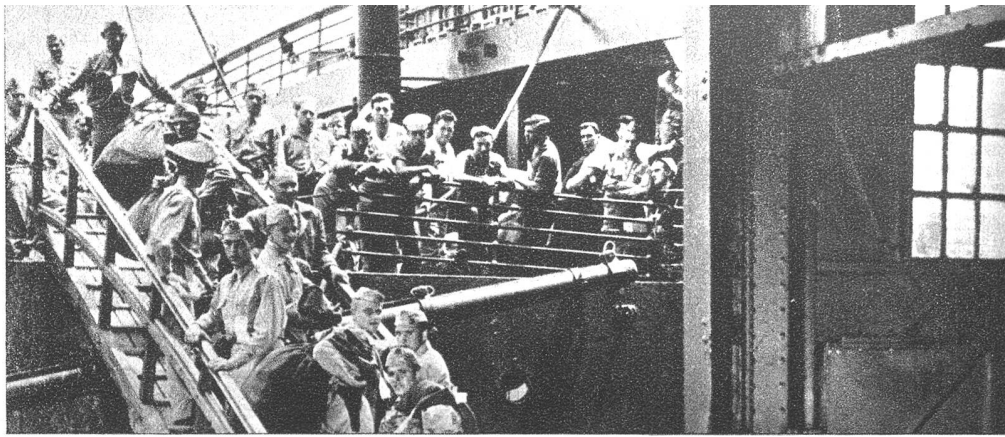
Die amerikanischen Truppen werden ständig verschifft, um gewisse Stützpunkte der U.S.A. zu besetzen.