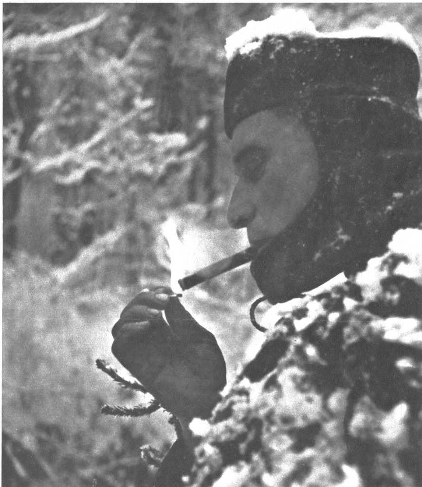
Hier ist es ausnahmsweise gestattet, auch während der Arbeit seinen Stumpen oder die Pfeife zu rauchen. Dankbar wissen aber die Soldaten die Grosszügigkeit ihres Vorgesetzten entsprechend zu revanchieren. Zudem ist's ja der Weihnachtsstumpen, den unser Wehrmann hier entzündet.

Stilli vertäute den ‚Saturn‘ an den eichenen Pfosten, zuvorderst am Eingang des Hafens. Sie waren die ersten.