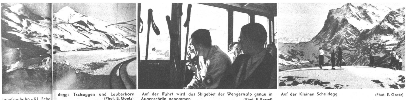
Jungfrauabahn - Kl. Scheidegg (Phot. E. Goret) | Tschuggen und Lauberhorn (Phot. E. Goret) | Auf der Fahrt wird das Skigebiet der Wengernalp genau in Augenschein genommen (Phot. F. Pernl) | Auf der Kleinen Scheidegg (Phot. E. Goret)