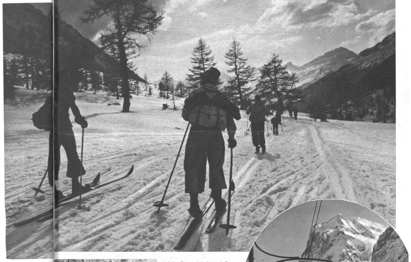
Auf der Skitour Jungfrau-Joch-Goppenstein: Bei der Falleralp