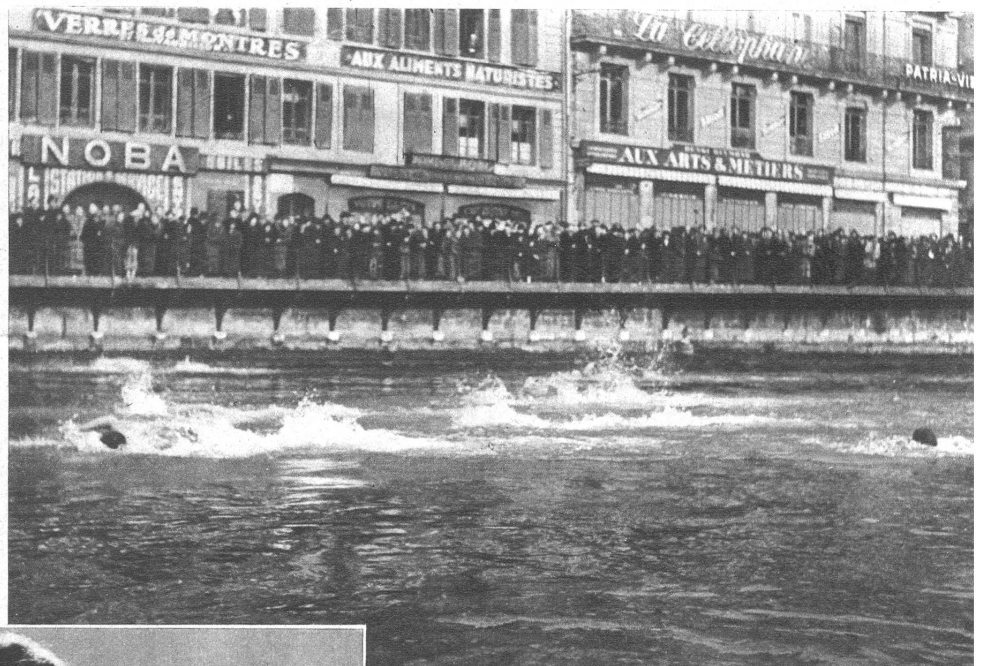
Das Weihnachtsschwimmen in Genf ist nach mehrjährigem Unterbruch dieses Jahr wieder durchgeführt worden. Acht Schwimmer aus Bern, Genf und Nyon bestritten die Konkurrenz von der Inselbrücke aus. Die Wassertemperatur stand auf 3 Grad unter Null! Wir zeigen die Konkurrenten kurz nach dem Start in den Wassern der Rhone. An der Spitze liegt hier bereits der Berner Kläber sich als schnellster Mann entpuppte und die Konkurrenz in neuer Rekordzeit jagte