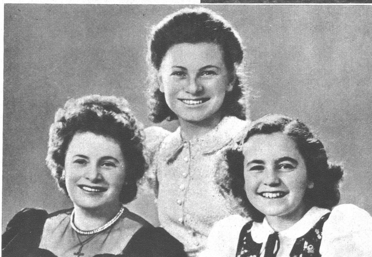
Eine ganze Schweizerfamilie als Kriegsopfer. Im vergangenen März reiste eine in Minusio ansässig gewesene Deutschschweizerin namens Schwarzenbach mit ihren beiden Töchtern nach Britisch-Indien, um dort zusammen mit ihrem Mann, der als Pilot einer wichtigen Fluglinie tätig war, wieder ein gemeinsames Heim zu gründen. Bei der Ankunft vernahm sie die Schreckensnachricht, dass ihr Mann nur wenige Tage vorher tödlich verunglückt sei. Die Frau entschloss sich wieder zur Rückreise in die Schweiz. Als sich die Mutter mit ihren Kindern auf der Rückreise befand, wurde das Schiff torpediert. Alle drei fanden den Tod in den Wellen. U. B. zeigt die Mutter (links) mit ihren beiden Töchtern