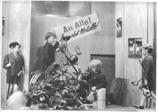
Schaufenster der Firma KZ Burgerli & Co. AG, Bahnhofplatz 1