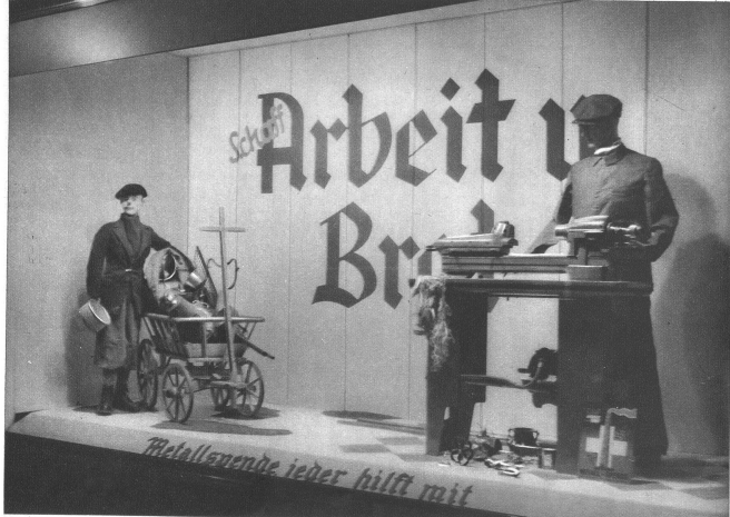
Schaufenster der Firma SCHWAB & CO. ARCHÉ der P. RÜFFEL, Marktgasse 3 CHE.