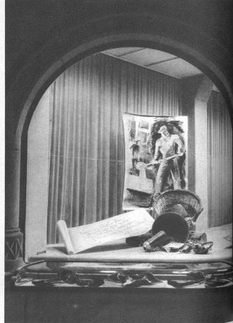
Schaufenster der Firma J. ZUBERBÜHLER AG., beim Zytglogger