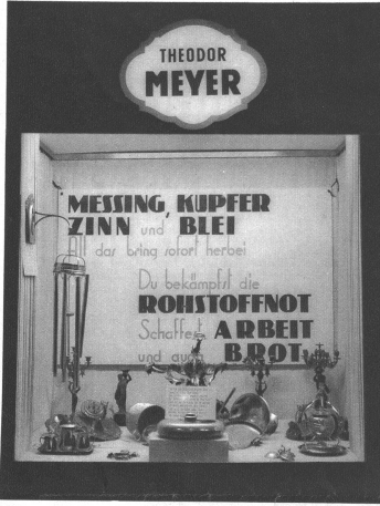
Schaufenster der Firma THEODOR MEYER, Marktgasse 32

„Meine alten Bleisoldaten, Einst geschenkt von lieber Hand, Heute müsst auch ihr marschieren, Auch ihr kämpft jetzt für das Land!“