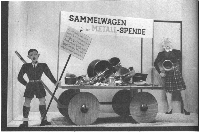
Schaufenster der Firma STOFFHALLE AG., Marktgasse 11