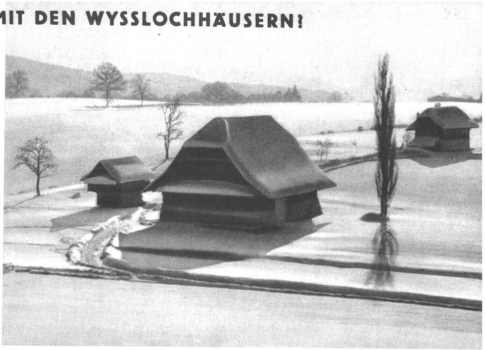
Speicher, Scheune und Stöckli im Wyssloch in Bern

Nun aber droht dem friedlichen Bild Gefahr. Schon rückt der Ostring, diese neue Strassenanlage in beängstigende Nähe heran, schon ist die Verlängerung der Laubeggstrasse beschlossen, und bald werden die herandrängenden Stadthäuser dem Idyll ein Ende bereiten. Was geschieht dann mit der schon jetzt wenig mehr benützten Scheune? Was wird aus dem selten schönen Speicherchen? Die Antwort wird dann die Burgerschaft der Stadt Bern geben. Deshalb braucht uns um das Weiterbestehen des über dreihundert Jahre alten Speichers nicht bange zu werden. Auch nicht um seinen Platz. Denn die Burgerschaft weiss den Wert dieses Kleinods der alten Landbaukunst zu schätzen. Sie hat es durch den bisherigen Unterhalt bewiesen. Vielleicht kann ihm sogar das elegante Schindeldach erhalten werden, samt dem kleinen Klebdach auf der Wetterseite. Denn Ziegeldächer auf solchen Häusern wirken wie ein Alpdruck und sind eine Vergewaltigung der edlen Proportionen, die der geschickte Zimmermann dem Gebäude zu geben verstand. P. Howald.