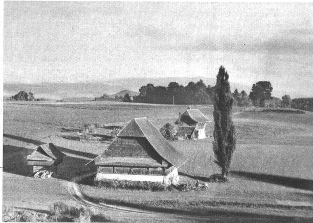
Die Wysslochgruppe im Sonnenschein des Herbstabends. Noch ist der Reiz dieser Landschaft erhalten, aber bald wird es im Hintergrund „bösen“