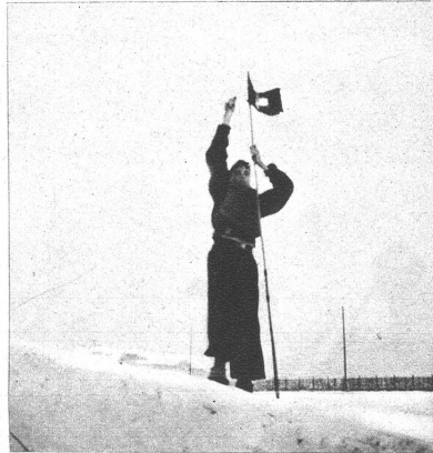
Der junge Erbauer, Kapitän und Besitzer des stolzen Schiffes hisst die Fahne

Nach Beendigung der Übungen, die etwa 4–5 Tage dauern, werden die aufgeboden Truppen, Pferde und Motorfahrzeuge wieder nach Hause entlassen.