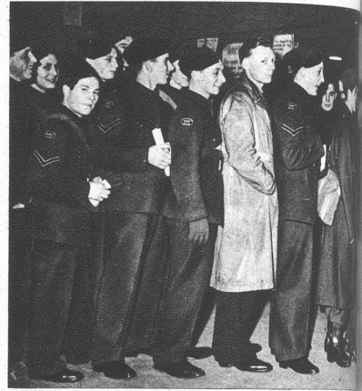
Rechts: In England melden sich 17jährige Jünglinge zum Dienst, und es haben sich 300 000 einschreiben lassen, um in den Krieg zu ziehen

Nach dem Fall Singapurs setzen die japanischen Streitkräfte ihre Angriffe fort, wobei sich die Richtung gegen Australien deutlich abzeichnen beginnt. Der schwach bevölkerte Kontinent befürchtet ernstlich eine Invasion und erwartet von England und Amerika vollwertige Hilfe