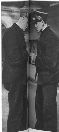
Die zwei besprechen, wie man ihnen leicht angesehen kann, und er

Geh's weder mit dem Velo noch per Auto — mit dem Schillien wird's geschafft. Der Dienstmann muss eben fertig sein