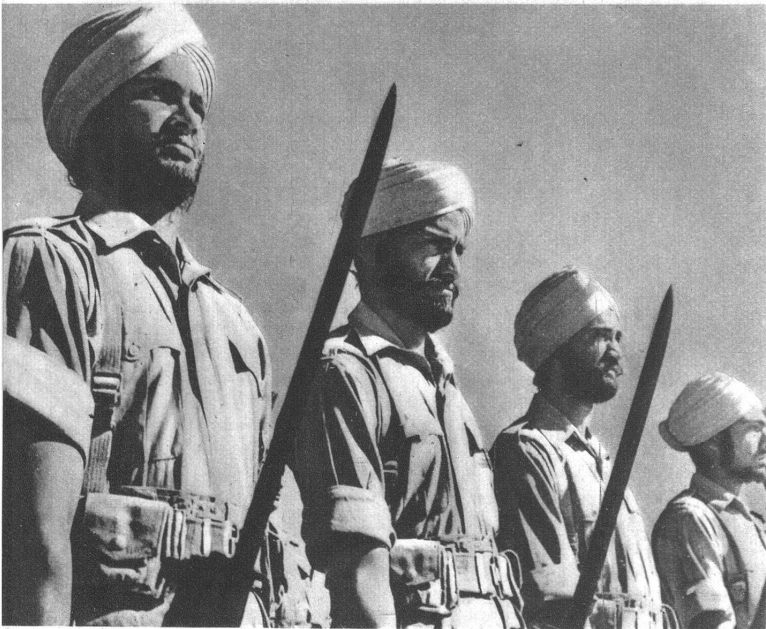
Indische Elite-Truppen stehen zur Abwehr bereit und gut durchgebildete Kontingente harren auf das entsprechende Kommando

Die Reise Sir Stafford Cripps nach Indien weist auf die Wichtigkeit des Problems hin, dem entscheidende Bedeutung für die Kriegsführung zukommt. Durch die Eroberung Japans steht heute Indien schon im Bereich der Kampfhandlungen. Für die Alliierten steht vieles auf dem Spiel und die Frage, ob Indien weiterhin als das Arsenal der Kriegproduktion aufrecht erhalten werden kann, ist sicher vom Erfolge des britischen Abgesandten abhängig.