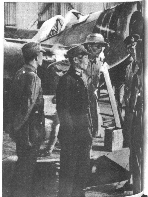
Rechts: Der Aufenthalt Tschiang-Kai-Scheks in Indien wurde mit den Anstrengungen, Indien für die Alliierten zu sichern, in Verbindung gebracht. Der chinesische General besichtigte die wichtigsten Flugstützpunkte