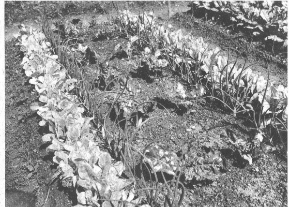
Rechts (Bild 4): Rippenmangold und Schnittmangold als Hauptpflanzung, Zwiebeln als Vor- frucht