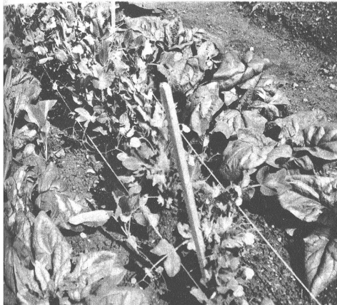
Links (Bild 3): Kabis als Hauptpflan- zung, niedere Erbsen „Monopol“ und Spi- nat als Vorfrucht