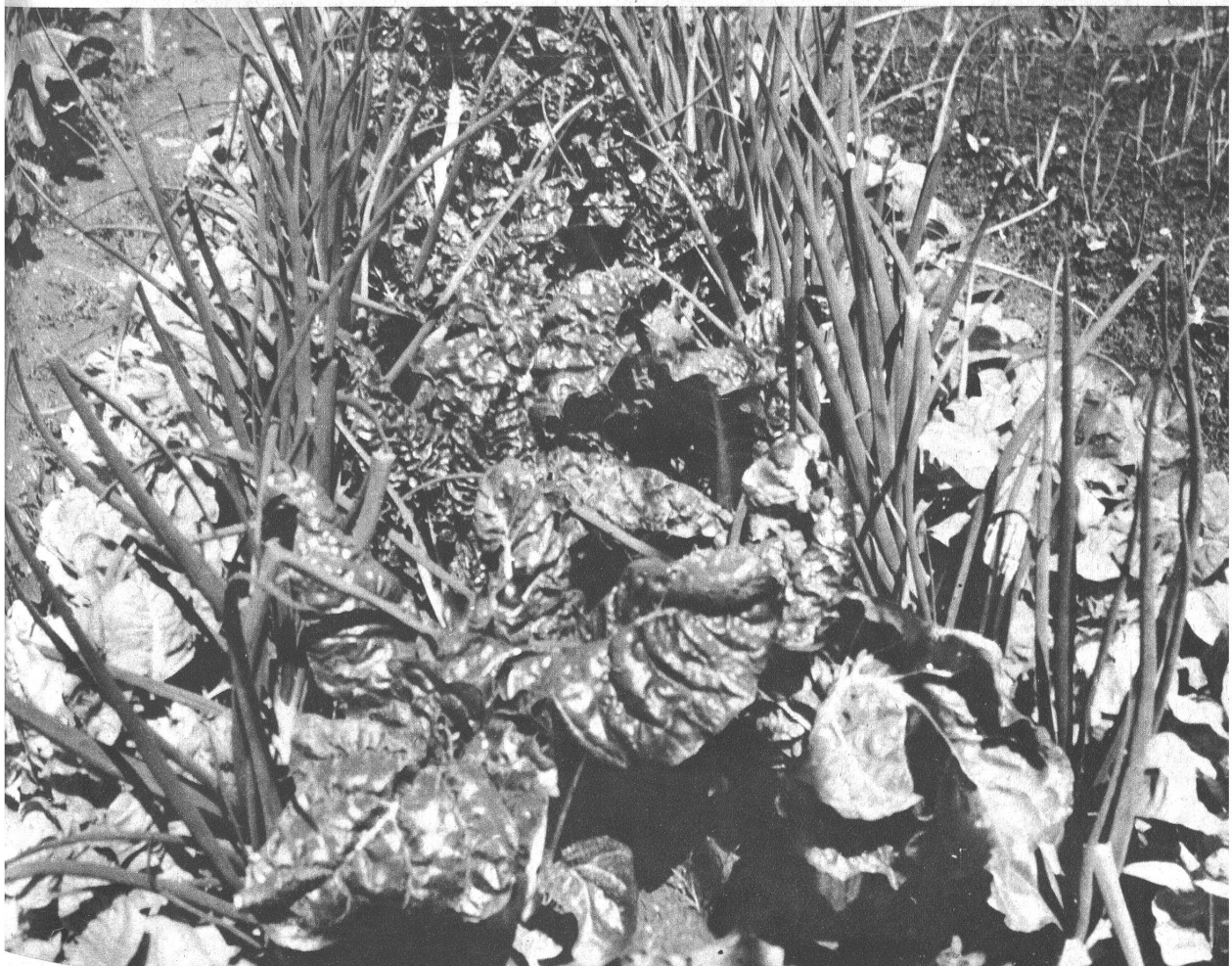
Unten (Bild 5): Das nämliche Beet, einige Wochen später