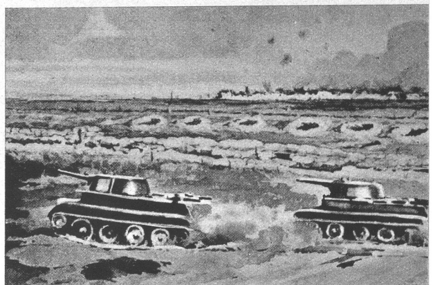
Die Russen haben gegenüber den deutschen raschen und leichteren Tankeinheiten ihre schweren Panzer eingesetzt, um durch Wucht den Nachteil der mangelnden Wendigkeit auszugleichen

Der Vorstoss der Russen im Raume von Charkow nimmt den Charakter einer Schlacht an, deren Endziel die Vernichtung der Kampfmittel zu sein scheint. Von beiden Seiten werden deshalb unaufhörlich Kampfmaschinen in den Kampf gesetzt, um jeden Stoss und jeden Angriff wuchtvoll anzubringen. — Die Russen trachten daneben im nördlichen Abschnitt von Charkow den Weg nach Kiew freizubekommen, im Süden dagegen tendieren die Angriffe nach Dnepropetrovsk und Odessa. Zu diesem Zweck müssen die Schlüsselpunkte bei Losovaja und Mariupol beherrscht werden, und es scheint, dass um diese Stützpunkte heftig gekämpft wird. — Die Achsenmächte dagegen haben nach ihrem Vorstoss auf Kertsch die Absicht, das Vordringen der Russen durch Gegenangriffe abzufangen und in Richtung über Stalino hinaus ihre Stellungen vorzutragen.