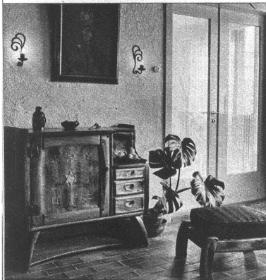
Ein typisches Beispiel, wie ein Ziermöbel durch ein praktisches und formschönes Modell ersetzt werden kann