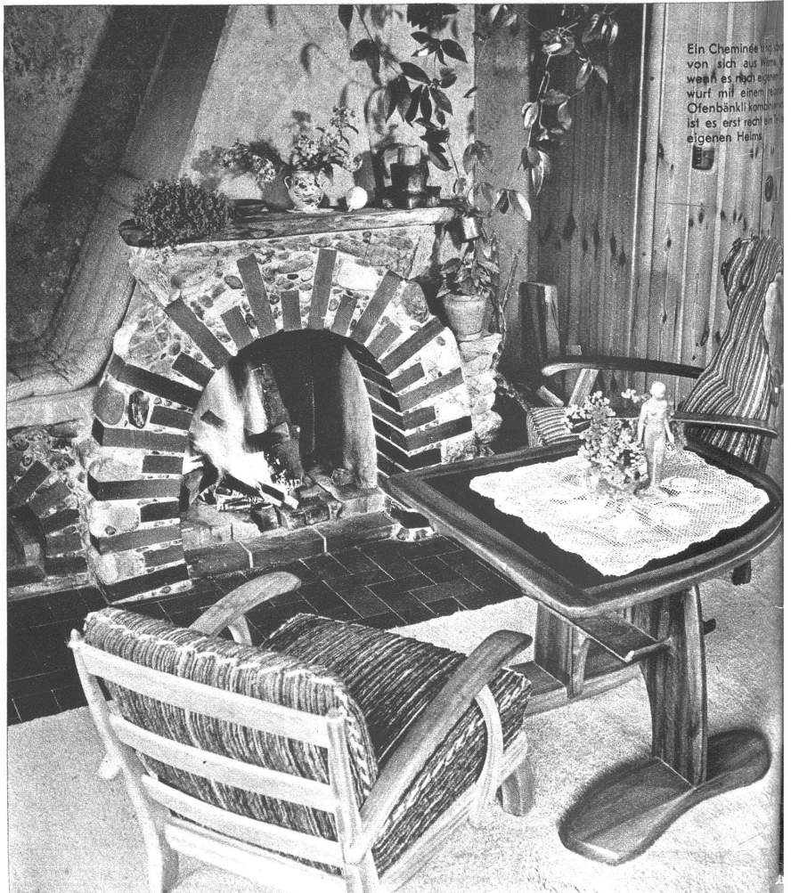
Ein Cheminée, das sich von sich aus harmonisiert, wenn es sich eigenmächtig mit einem heissen Ofenbänke kombiniert, ist es erst recht ein Teil des eigenen Heims