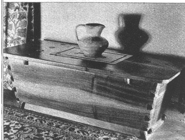
Auch in moderner Form wirkt eine Truhe heimelig und gibt der Wohnung den Ausdruck besonderer Behaglichkeit