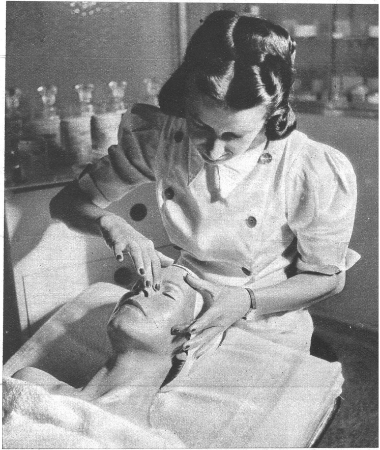
Massage der Augenpartie

Um das allgemein gefürchtete „Altern“ zu überwinden, bedient man sich heute der auf höchster Stufe stehenden Kosmetik. Altern ist nichts anderes, als das Welken- und Schlaffenwerden der Haut und Muskulatur. Somit ist es unbedingt notwendig, daß man diesen Übeln mit geeigneten Mitteln entgegen tritt. Gesichtspflege ist heute eine Notwendigkeit für jede Frau. Eine gepflegte Frau wirkt immer schön. Es liegt heute kein Grund mehr vor, daß nicht jede Frau sich eine angemessene Gesichtspflege angedeihen lassen kann. Die Schönheitspräparate dienen im Grunde alle demselben Zweck: 1. Die Haut zu reinigen von Staub und Puder und Unreinheiten. Dazu kann man sich eines Reinigungswassers oder einer Reinigungscreme bedienen. 2. Anregen und Beleben der Haut mittels Vapozone-Behandlungen oder stimulierenden Wasser und Cremen. 3. Die Haut ernähren, geschmeidig und weich erhalten. Da gibt es Cremen von außer-