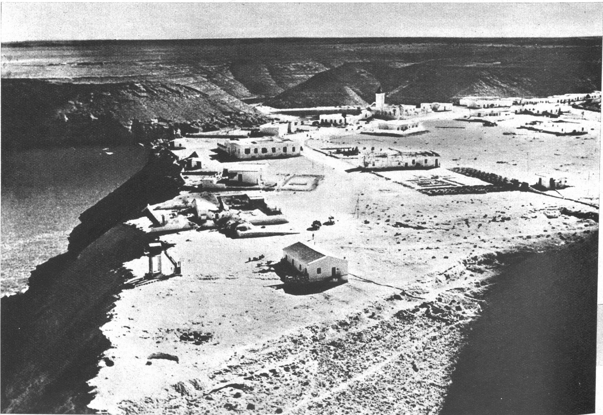
Ansicht von Bardia

Die Armeegruppe General Rommels, welche Tobruk von Osten umfasste, musste sich nicht lange aufhalten. Da die Festung, die vor einem halben Jahre nach achtmonatigem Widerstande von den Empiretruppen entsetzt wurde, diesmal sich sofort ergab, konnten die Panzerkolonnen der Kriete entlang weiter vorrücken und Bardia nehmen. Die Achsenstreitkräfte stehen damit wieder vor den Toren Aegyptens; da kaum anzunehmen ist, dass die grosse Aktion nur der Eroberung eines Wüstenstriches gedient haben sollte, ist es sehr gut möglich, dass Rommel nun seine Offensive ins Land der Pharaonen vorträgt. Sollte ihm aber gelingen, sich der Oelfelder des mittleren Orients zu bemächtigen, so wäre das eine ganz besondere Stellung der Position.