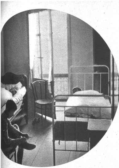
Unsere Buben beim Mittagsschläfen Links: Ansicht des Ferienheims Schweibenalp Rechts: Nachmittags-Spielvergnügen Unten: Verpflegung unter väterlicher Obhut

wiedererschienene Sonne. Wieder beginnt das Spielen und Glückseligkeit und so gehen die Tage nur allzurasch herum. Erholt und gestärkt an Leib und Seele kehren dann die Buben wieder in ihr elterliches Heim zurück, neben dem gesundheitlichen Nutzen, um eine nie verblässende schöne Erinnerung bereichert.