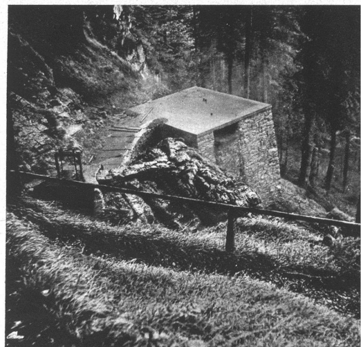
Das eigene Kraftwerklein