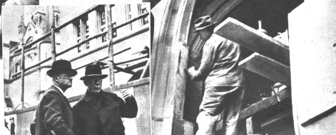
(Reportage der Ph.-P.)

Wer wird da gehängt? Es ist kein Lynchgericht, hier handelt es sich um das Hochziehen der Hauptfassade bestimmten Plastiken, die im Vordergrund (links) geschaffen hat. Zwei Berner Bürger aus der Altstadt, die das alte Rathaus gründlich verfolgt, veröffentlichen ihre Meinung über diese oder jene Umgestaltung.