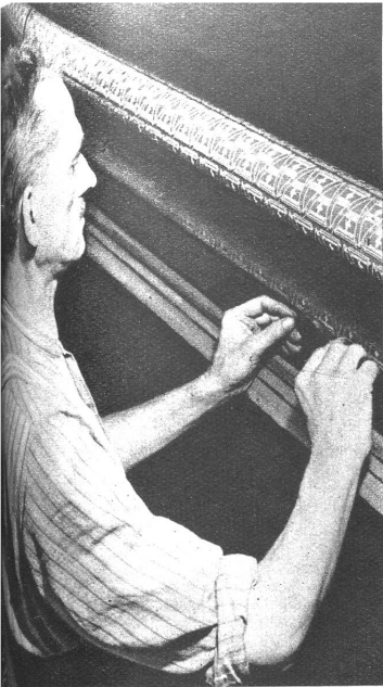
Die Aufgabe, welche sich die Schweizerische Winterhilfe gestellt hat, wird immer bedeutungsvoller, je länger der Krieg dauert. Unser Bild oben zeigt die Handmaschinensticken des roten Winterhilfs-Abzeichens in Speicher. — Bild unten: Eine Appenzellerin schmückt ihren Tracht über ihrem Stickmaschinen, um in sorgfältiger Handarbeit das zierliche Abzeichen der Winterhilfe 1942 zu schaffen