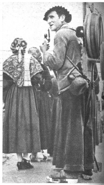
Die New Yorker Hafen ist mit amerikanischem Kriegsgerät in einem Handelshafen in einen Kriegshafen worden. Unübersehbare Mengen von Öl und Kohle kommen zum Verlad in die Geleitzüge. Ein Volksfest Italiensch-Bündens Bergeller Alpen mit der Ausrüstung für die Alpen. — Unten: Bergeller Gruppe, Jäger und Junge beim Umzug anlässlich des Volkstages der deutsch-sprechenden Bündner Teiler in Chur