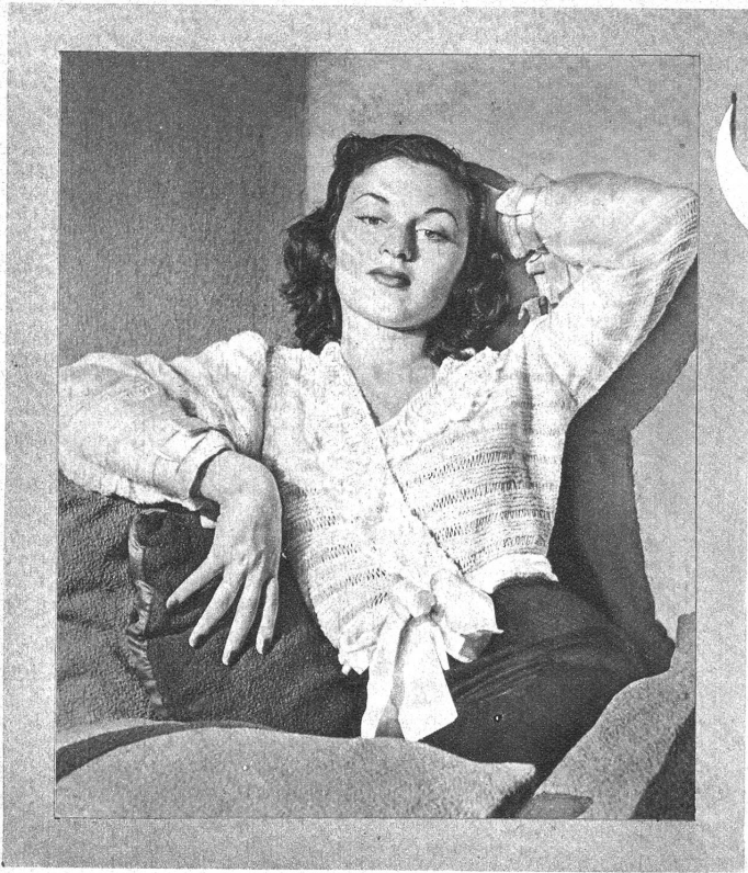
Abb. I. Bettjäckchen. Grösse I. Material: Etwa 400 g Wolle, Stricknadeln und Häkelnadel Nr. 3, Seidenband. Arbeitsweise: Alle Teile des Bettjäckchens nach der Schnittübersicht Ia stricken. Man beginnt die beiden Vorderteile am unteren Rande mit je 82 M. (Maschen), den Rücken mit 84 M. und die Aermel mit je 64 M. (wenn 2 M. 1 cm ergeben). Für das Querstreifenmuster 8 Reihen hin- und zurückgehend rechts, hierauf 1 Reihe abwechselnd 1 M. rechts und 4 Umschläge, dann 1 Reihe rechts, dabei die Umschläge fallen lassen, so dass die M. langgezogen wird, vom Anfang an stets wie