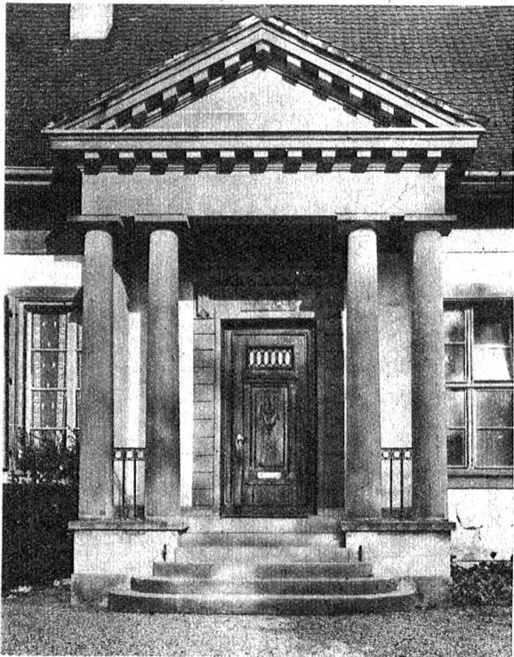
„D'Hustüre vo der Waldeck steit under mens Frontispice mit Sandsteisüüle". Rechts: Die „Waldeck" bei Bern, der „Lindehof" im Roman „Veteranezyt"