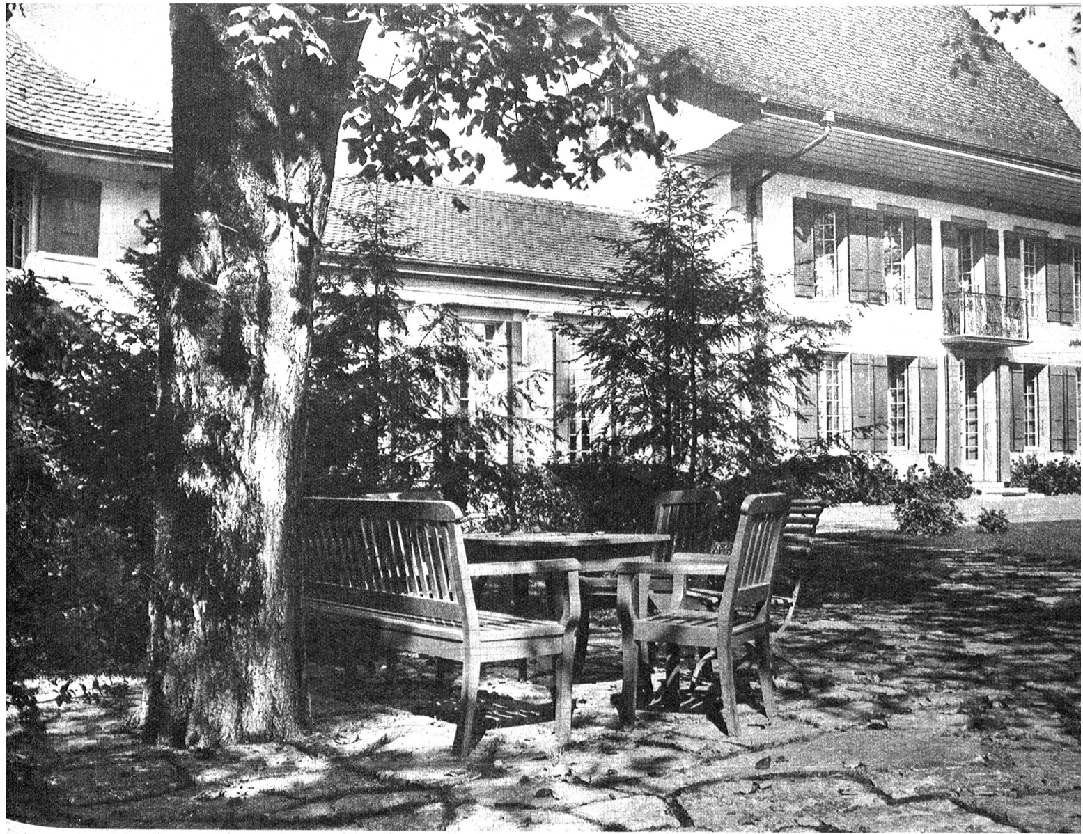
Allmendingen, eine heimelige Ecke in dem prächtigen Schlosspark