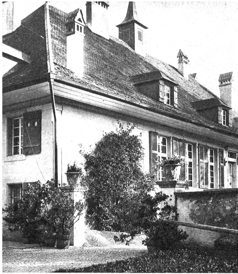
Ursellen. Hier in der „Turnelle“ spielt die ergreifende Geschichte vom „Frondeur“

Jene einzigartigen bernischen Landsitze, Zeugen vergangener Zeiten und wechselvoller Schicksale, die uns durch von Tavel's Werke so lebendig nahe sind, dürften mit ihren Namen wohl den meisten Lesern bekannt sein. Wenige aber wissen, wie sie in Wirklichkeit aussehen.