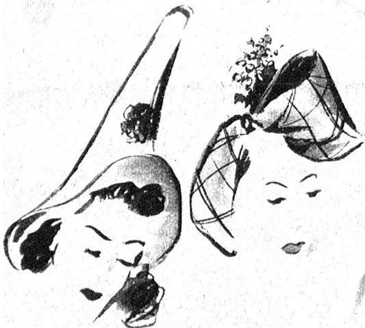
Der „Minnesänger-Hut“ aus Wohlener Stroh und ein Seidenturban mit Maiglöckchen