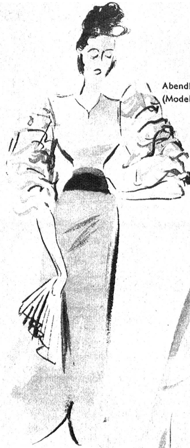
Abendkleid (Modell Gaby Jouval)