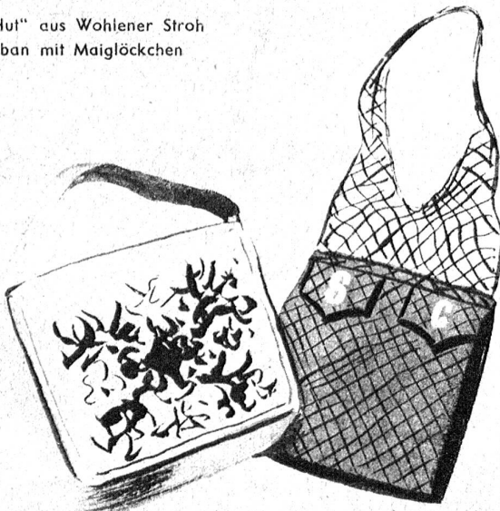
Schöne bestickte Tasche