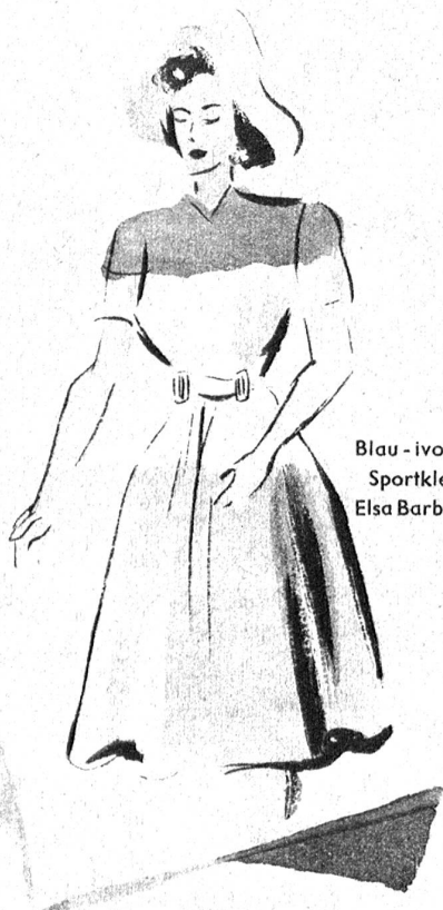
Blau - ivoire - braunes Sportkleid (Modell Elsa Barbéry, Lugano)