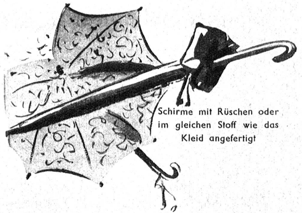
Schirme mit Rüschen oder im gleichen Stoff wie das Kleid angefertigt