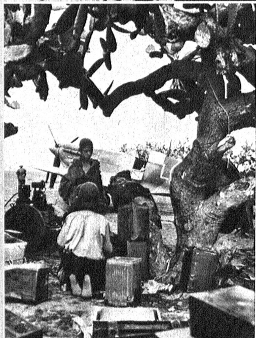
Kaktusbäume dienen an der tunesischen Front als vorzüglicher Tarnschutz für Flugzeuge