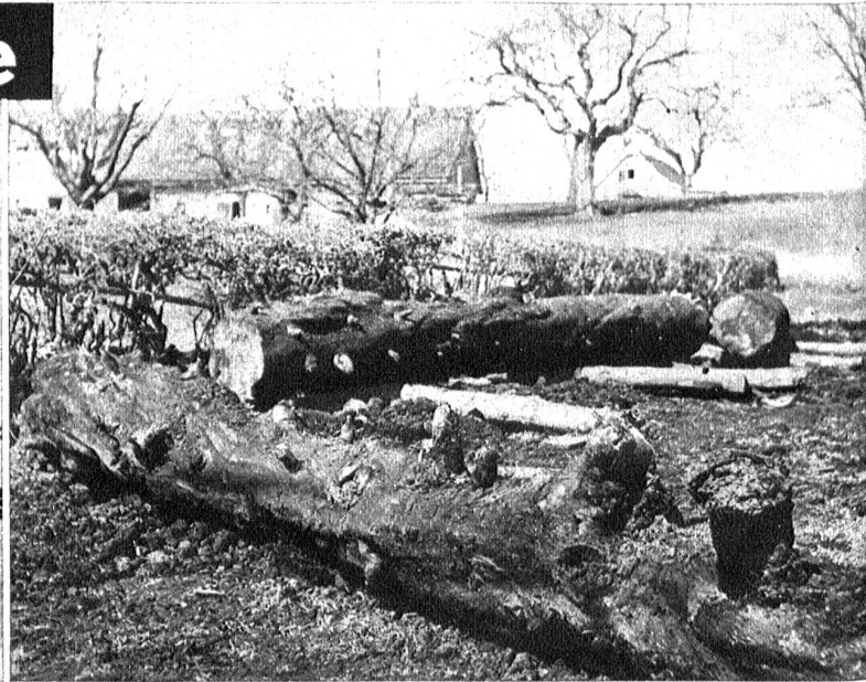
Oben: Bei Drainage-Arbeiten in der Nähe von Sankt Gallen ist man auf die Ueberreste eines prähistorischen Waldes gestossen. Dabei wurde ein vollständig erhaltener Tannenbaum aufgedeckt, der wohl etliche tausend Jahre in Torf und Lehm gebettet lag