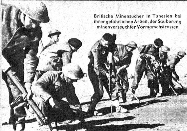
Britische Minensucher in Tunesien bei ihrer gefährlichen Arbeit, der Säuberung minenverseuchter Vormarschstrassen