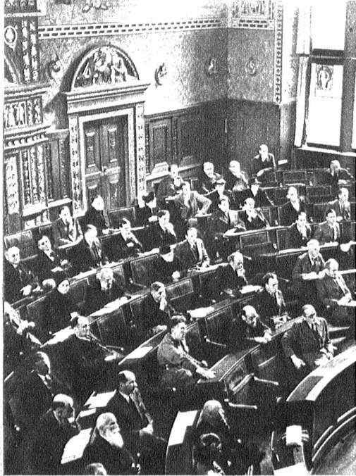
Der schweizerische Schriftstellerverein hielt am letzten Wochenende in Basel seine Jahrestagung ab. Dieses Zusammentreffen hat gerade heute seinen tieferen Sinn: die Wahrung der Geistesfreiheit