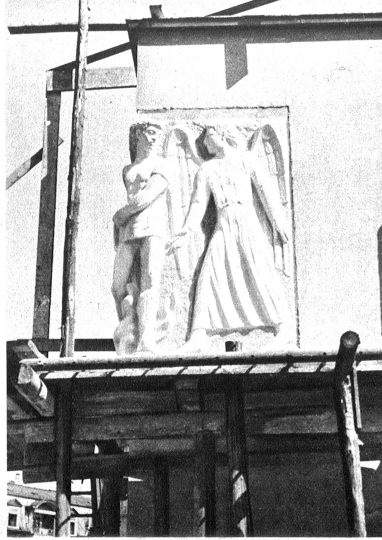
Das neue Relief am Feuerwehrgebäude, den Florian und seinen Engel darstellend.