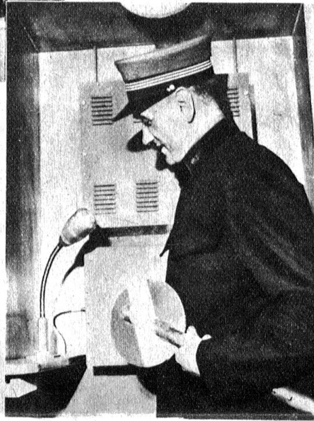
Rechts: Dem Bahnhof Lausanne war es vorenthalten, die erste Bahnhof-Lautsprecheranlage der Westschweiz in Betrieb zu nehmen. Jetzt gibt der Bahnhofvorstand in klarer Sprache Auskunft über Eintreffen und Wegfahrt der Züge