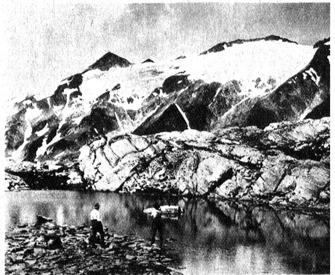
Piz Medel vom Seelein oberhalb Greina-Pass

Es dämmt schon, als wir bei einer Wegbiegung einen dunklen, wundersam schönen Bergsee erblicken — die Quelle des Po. Kein Zufluss speist ihn. Spiegelglatt liegt die Wasserfläche, von keinem Hauch getrübt. Fast andächtig schreiten wir dem Ufer entlang zum Ausfluss, wo ein bescheidener Bergbach über eine letzte Talstufe zum