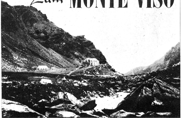
Piano del Re