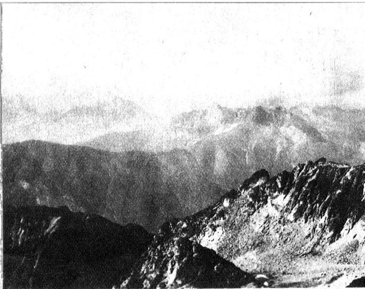
Aussicht vom Monte Viso