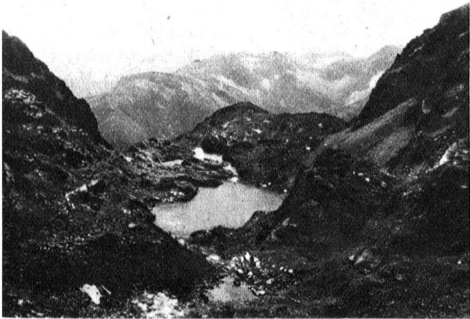
Vom Col de la Traversette nach Süden

Piano del Re springt. Ringsum blaut ein dunkler Abendhimmel. Die Schatten einer lauen Sommerbergnacht senken sich hernieder. Abschied: ein letzter Blick zum märchenschönen Bergseelein, dann folgen wir dem jungen Po und bald dröhnen unsere ungeschlachten Bergschuhe im Gasthause von Piano del Re.