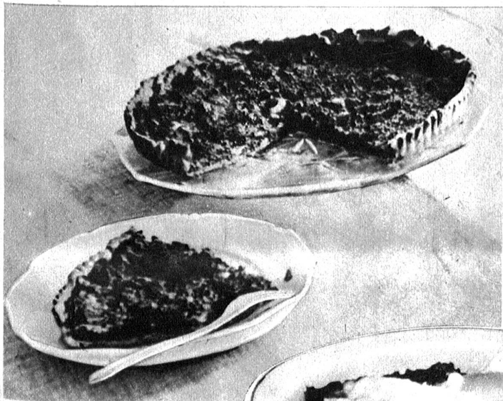
Spinatkuchen mit Speckwürfeli

Junger Spinat einigemal unter laufendem, kaltem Wasser gut waschen. Nicht abbrühen. Grob hacken oder durch die Hackmaschine treiben. In letzterem Falle ist es notwendig, den Spinat noch 3 Minuten in lauwarmes Wasser zu legen. Wir bereiten uns einen Kuchenteig aus 250 g Mehl, 1 Glas leicht gesalzenes, lauwarmes Wasser, ½ Glas Öl oder halb Öl und halb Fett. Sofort tüchtig miteinander verarbeiten, bis sich der Teig von der Schüsselwand löst. Ausrollen. Der Spinat wird in ca. 50 g Speckwürfeli mitgedünstet; gut würzen und sofort auf dem Kuchenteig auftragen. Sehr gut ist es, wenn der Spinat noch mit einem Schalenei gebunden werden kann. Heiss servieren mit Milchkaffee und mit einer währschafenen Suppe.