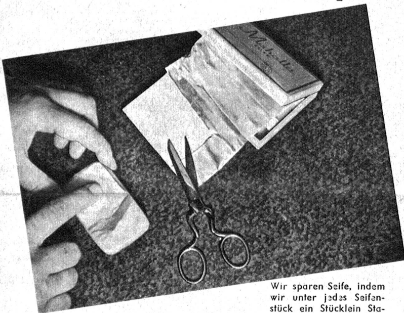
Wir sparen Seife, indem wir unter jedes Seifenstück ein Stücklein Staniol kleben