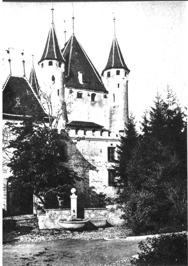
Links: Der Eingang zum Schloss, der alten Zähringerburg in Thun