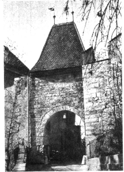
Rechts: Das Burgtor. Während in der Stadt die mittelalterlichen Tore dem zunehmenden Verkehr zum Opfer fielen, sind auf dem Schlossberg der äussere und der obere Torturm erhalten geblieben. Das hier abgebildete Tor gehörte zu einer Vorburg an Stelle der Helferei