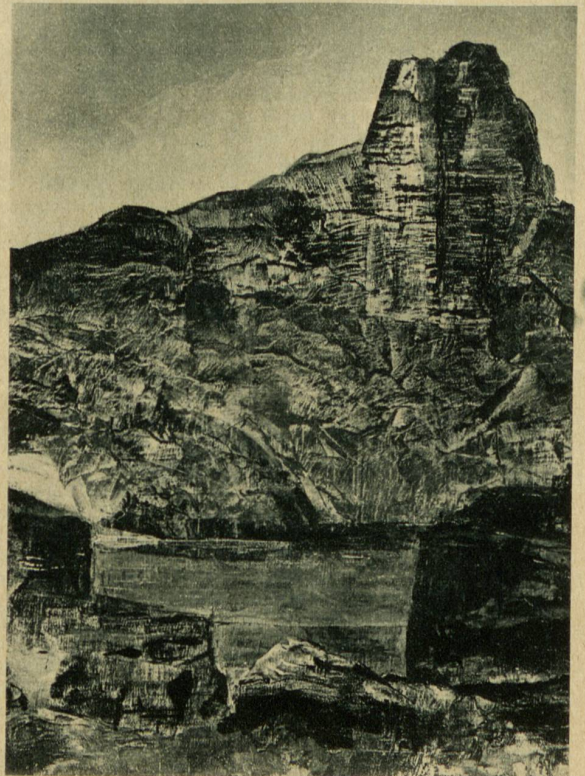
Berglandschaft. Bild links: Rohrbachstein am Rawil

Erinnerung. Die Kunstbegeisterten verehrten ihn als Schöpfer des deutschen Requiems und des Triumphliedes. Besondere Freundschaft verband ihn mit Herrn Widmann, dem Redaktor am „Bund“ in Bern. 1899 liess der Einwohnerverein Thun am Springhaus eine Marmortafel anbringen, deren Inschrift die kommenden Generationen an den genialen Meister im Reich der Töne erinnert.