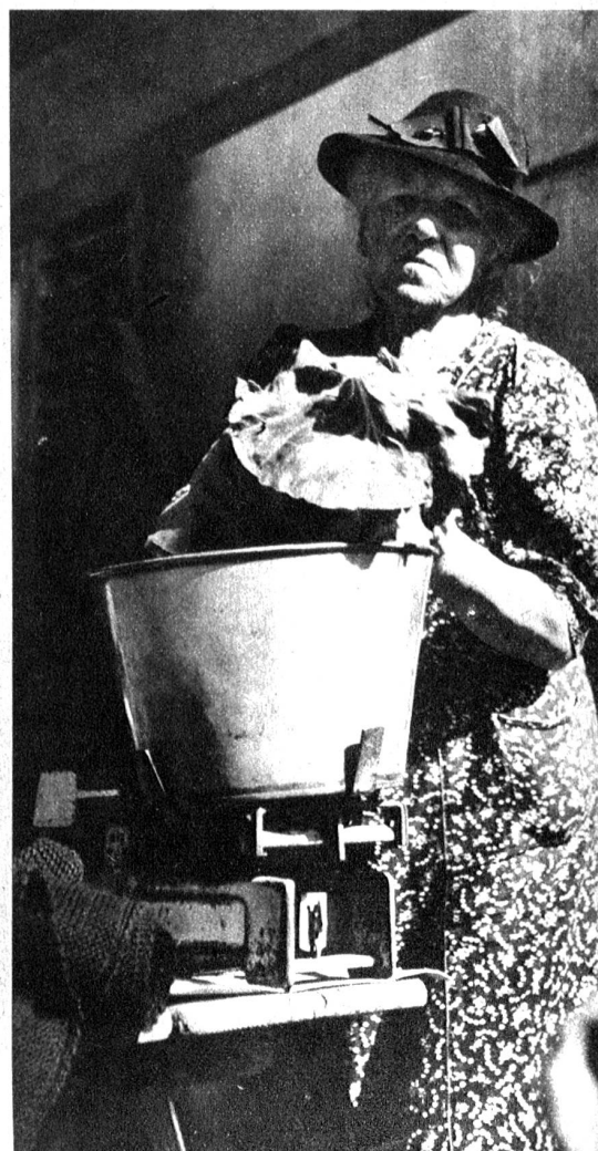
„Dä schön Chabis isch gwüss nid z'für“