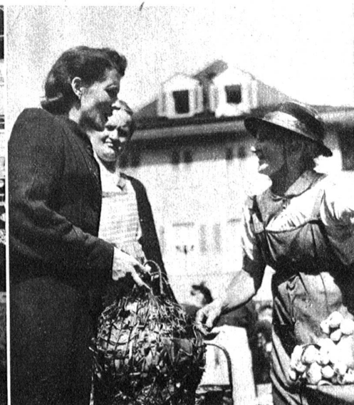
Der Einkauf ist bei der grossen Auswahl eine Freude

Wirtschaft ein völliger Zusammenbruch im Hinblick auf die Möglichkeiten und Notwendigkeiten in den Nachkriegsjahren nicht eintreten. Hilfsmassnahmen des Bundes und der Kantone sind daher im Interesse der Allgemeinheit.