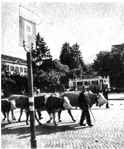
Zu den weit herum bekannten Viehmärkten wird viel schöne Ware in die Stadt gebracht

Als erster Marktplatz diente der befestigte Brückenkopf an der Sinni, d. h. das Areal vor dem Freienhof. Schon im 15. Jahrhundert verlegten die Behörden den „Rindermerit“ auf den Rathausplatz. Bald kam er in die Markt-gasse und vor 50 Jahren auf den einstigen Platz des Stadtgrabens und Zwingelhofs zwischen Berntor und Kleintöri. Verwundert blicken die zinnengekrönten Stadtmauern und der anno 1641 gebaute Venner-Zyroturm auf das heutige Marktgetriebe, das jedoch in vielem durch alle Jahrhunderte gleich geblieben ist.