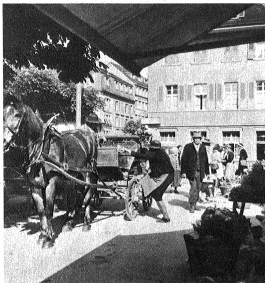
Die Landbevölkerung benützt den Markttag in der Stadt zu den nötigen Einkäufen, um dann zu Mittag oder am Nachmittag wieder heimzufahren

besteingerichteten Werkstätten müssen stillstehen, wenn es unsern Behörden nicht mehr gelingen sollte, vom Ausland die notwendigen Rohmaterialien oder Ersatzstoffe hereinzubringen. Das Thuner Gewerbe ist mit dem gesamten Gewerbe-