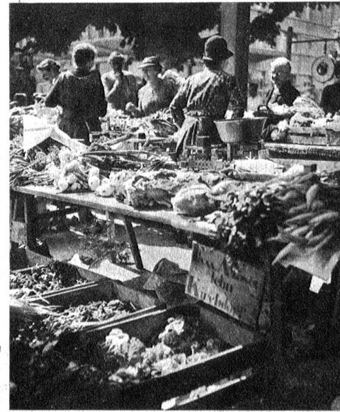
Auf den Thunermarkt kommen die Bauern der ganzen Umgebung und bringen ihre schöne Ware zum Verkauf