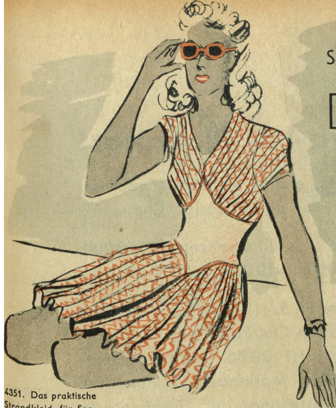
4351. Das praktische Strandkleid für Sonnenbäder ist eng gefaltet und mit einem breiten glatten Gürtel versehen