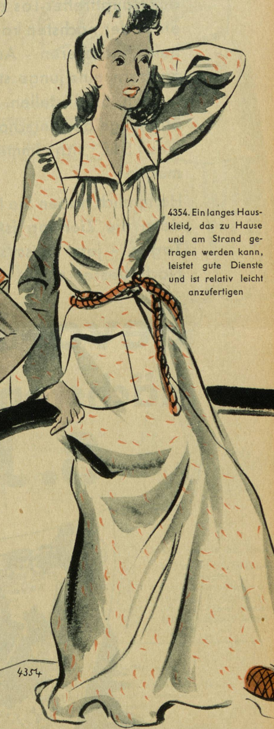
4354. Ein langes Hauskleid, das zu Hause und am Strand getragen werden kann, leistet gute Dienste und ist relativ leicht anzufertigen