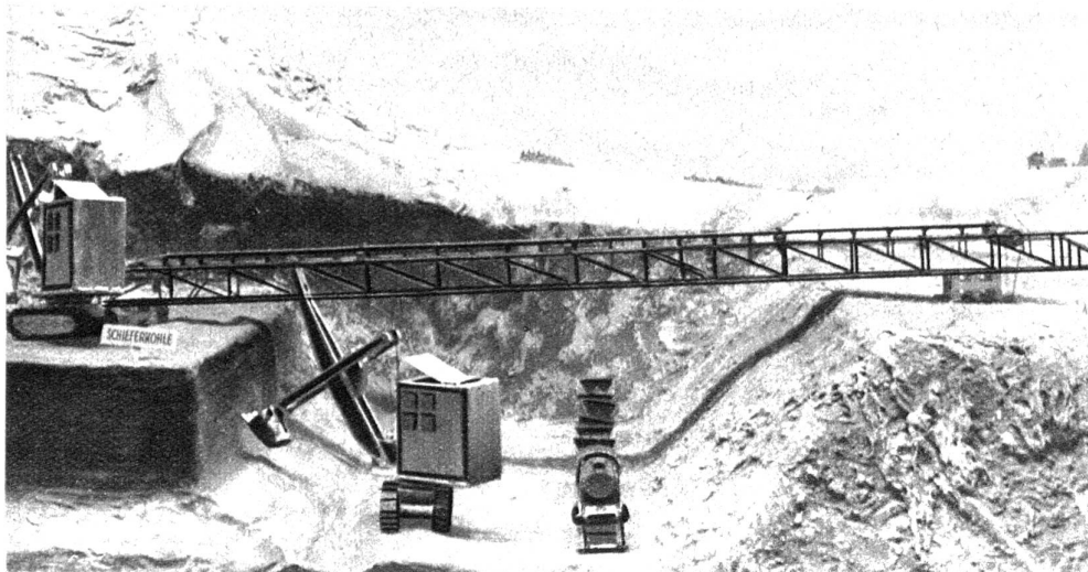
Links: Das Modell eines Schieferkohlen-Bergwerks zeigt im Schaufenster der Ausstellung den Vorgang beim Tagbau