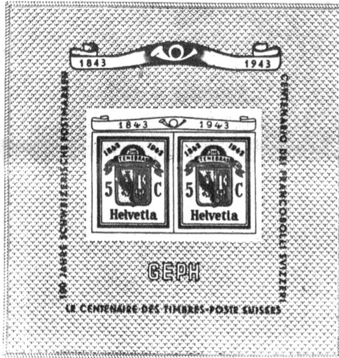
Rechts: Zum Abschluss des Jubiläumsjahres „Hundert Jahre Schweizerische Postmarken“ bringt die PTT-Verwaltung einen Gedenkblock mit einem Frankaturwert von „Doppelgenf“ mit einem Frankaturwert von 10 Rappen zu Fr. 3.- heraus. Der Netto-Ertrag wird dem Schweiz. Roten Kreuz überwiesen