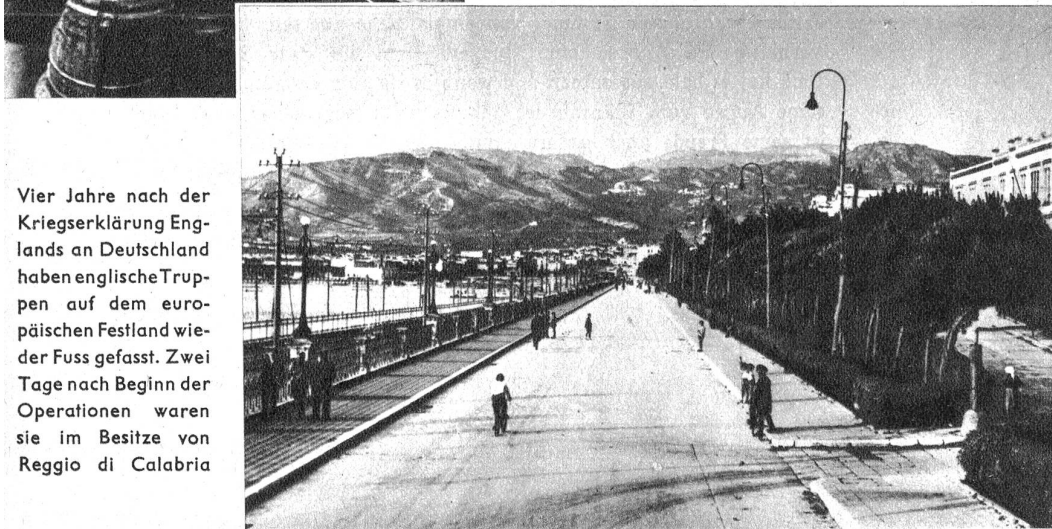
Vier Jahre nach der Kriegserklärung Englands an Deutschland haben englische Truppen auf dem europäischen Festland wieder Fuss gefasst. Zwei Tage nach Beginn der Operationen waren sie im Besitze von Reggio di Calabria