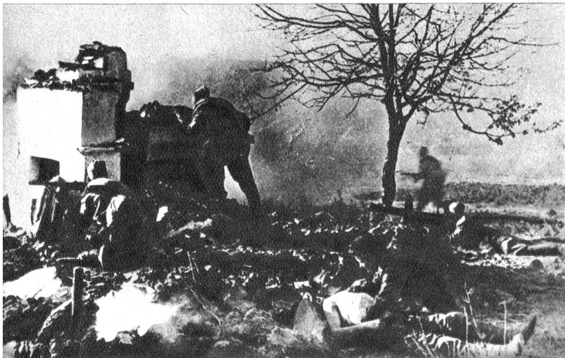
Halbwegs zwischen Taganrog und Mariupol haben die Russen nach der Einnahme von Taganrog eine neue Frontlinie errichtet um den deutschen Rückzug zu stören. Die russische Sanität folgt bis in die vorderste Linie