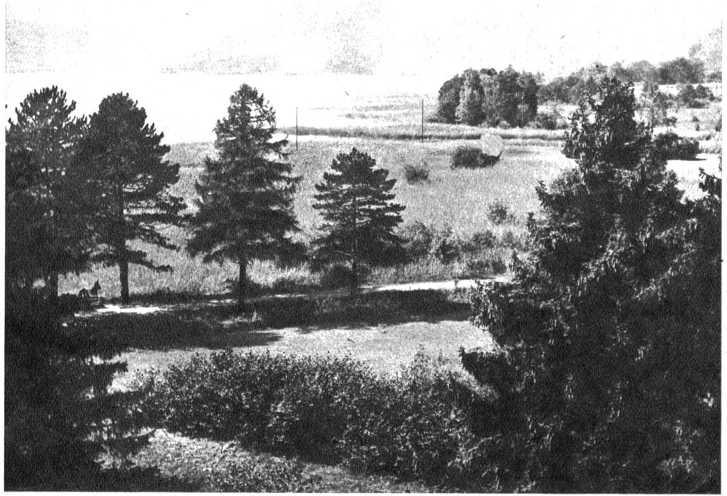
Oben: Der Regierungsrat des Kantons Bern hat das Gebiet von Neuhaus bis zur Weissenau, längs dem Thunersee-Ufer als Naturdenkmal erklärt und dauernd unter den Schutz des Staates gestellt