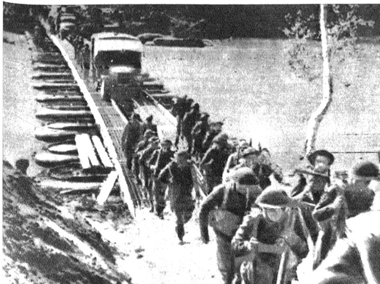
Unten links: Der Sieg der 5. Armee am Voltorno wurde mit dem Einsatz modernster technischer Hilfsmittel errungen. Sofort nach der Sicherung der Brückenköpfe schritten die Pioniere zum Bau von Notbrücken. Unser Bild zeigt eine dieser Pontonbrücken aus Gummi-Pontons und zusammensetzbaren stählernen Fahrgeleisen, die den Nachschub von Kriegsmaterial ermöglichen (Funkbild)