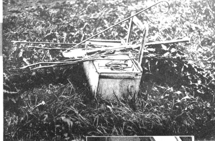
Oben: Das ganze Geschäftsvorwerk des Mäusers: ein kleiner Spalten, ein eiserner Stock mit einer Verdickung am Ende zum besseren Absuchen der Mäusegänge, ein Busch Laubkraut zur Stellmarkierung der gestellten Fallen, und natürlich auch einige hundert Fallen selbst. Fische, Katzen, Hund und Raubvögel haben ihm schon bis zu 50 Fallen in einer Nacht geklaut. Rechts: Die Arbeit ist fertig, das Gelände sorgfältig abgemäust. Der Fang war nicht gross, hat aber gleichwohl wieder einige Franken eingebracht. Armselig bekleidet, die Hosennähte überflückt, sonst aber pfeiflich seuer, selbst die Krawatte fehlt nicht, verlässt er den Hof des Wylergutes. Allzuweit kommt er seine Kiste nicht mehr tragen, darum, und nur darum hat er sich den Luxus eines Leiterstügelchens gestattet. Wehmütig verlässt er den Hof, es ist das letzte Mal, dass er hier gemäust hat. Alles hat sein Ende, sagt er und geht seines Weges.