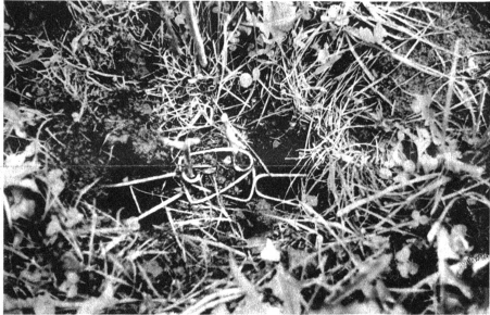
Rechts: Für Springmäuse gerichtete Fallen. Während die Fallen für Maulwürfe sorgfältig gedeckt werden müssen, damit auch gar kein Lichtstrahl in die finsternen Erdgänge fällt, wird der blossgelegte Springmausgang einfach offen gelassen, denn diese Tiere kommen fast den ganzen Tag ans Tageslicht, um ihre Nahrung zu suchen.

„Weiss nicht, Sah nicht hin“, gestand Mettler Mariel stockend und wollte, ihre Tasche ergreifend, fort gehen, die Haide hinab, aber die junge Frau hielt sie zurück und bat: „Nicht so, Marieli. Bleib bei mir. Auch ich fürchte mich fast ... weil Grossätti so anders ist wie sonst. Hörst, nun fragst er wieder nach einem Büblein.“ Sie ging in die Stube, redete beruhigend und kam dann mit einem alten, weissbärtigen, gebückten Manne heraus, der nicht mehr allein gehen konnte. Mühsam bettete sie ihn auf ein Kissen auf der Hausbank, wo er wieder, ohne das fremde, verlegene Mädchen zu bemerken, seine Litanei murrmelte: „Annelies, hast dem Büblein Milch und Brot gegeben? Jag die gute Frau nicht fort, Trini“, schrie er plötzlich auf, sank wieder in sich zusammen und ächzte: „Hast dem Büblein im Webkeller ... dem Büblein ...“ „Ja, ja, Grossätti“, beruhigte die Bäuerin mitleidig. „Habt ihr ein krankes Büblein?“ „Nein, weder ein gesundes noch ein krankes“, lächelte Frau Annelies, „aber in den nächsten Tagen, will's Gott, ein gesundes, kleines Kind im Weidenkorb. Gäll, du bleibst ... oder wirst erwartet?“ „Nein. Ich ... vagabondiere auch in der Welt herum, wie jener Bursche“, gestand Marieli, dunkelrot werdend.