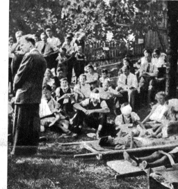
Vor der Einfahrt des Bauernhauses werden die Verletzten ins Freie verbracht

heissen? Hatte das witterwendische Mädchen etwa einen neuen Schatz aufgefunden in den vergangenen Wochen, da es der Langenthaler Base helfen sollte, einen, der vom vornehmen Geschmeiss da abhängig war? Sein Bauernstolz rührte sich. Er übersah die ihm entgegengestreckte Frauenhand und knurrte: „Werden sehen, Meitschi, hilf in der Küche, damit wir zu Nacht essen können! Dann hilfst beim Eintragen, verstanden! S'ist Samstag heut!“ „Ja, Vater“, sah ihn Marieli an, heimlicher Freude voll, „ich will nachmachen, was ich versäumt, Vater. Schläpfe nur in die Werktagskleider.“ „Nichts da“, tönte plötzlich eine bekannte Stimme von der Einfahrt her, wo Pferdcköpfe sich zwischen herabhängenden Halmen und Achren durchzwängten. Ueber rascht sah die Heimkehrende hin: „Müllerfriz, Du hilfst auf dem Mettlerhof? Grossen Dank!“ „Nichts zu danken, Marei“, lachte ihr dieser zu. „Es geschieht nicht deinetwegen! Bist weit und gut gereist?“ „Ueber alle Massen gut!“ nickte sie errötd, die Hand zum Grasse reichend. „Wie es heisst in der Bibel: „Und ob ich auch wanderte im dunklen Tal, fürcht ich kein Unglück, denn du bist bei mir.““ „Desmal meint sie nicht nur den Herrgott, sondern auch den, den er ihr schickte, sie an Licht und Sonne zu führen, gäll, Marie Marei!“ scherzte Gaston von Wattenwyl, der sich beiden zugesselt. „Holla, gibt's Haber und Wasser