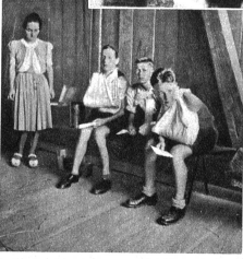
Links: Das sind Leichtverletzte, die am Unglücksort verbunden wurden und sich dann selber ins Spital begaben