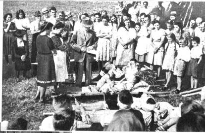
Rechts: Ein besonders schwieriger Fall wird eingehend besprochen