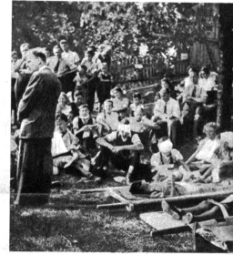
Vor der Einfahrt des Bauernhauses werden die Verletzten ins Freie verbracht

heissen? Hatte das witterwendische Mädchen etwa einen neuen Schatz aufgefunden in den vergangenen Wochen, da es der Langenthaler Base helfen sollte, einen, der vom vornehmen Geschmeiss da abhängig war? Sein Bauernstolz rührte sich. Er übersah die ihm entgegengestreckte Frauenhand und knurrte: „Werden sehen, Meitschi, hilf in der Küche, damit wir zu Nacht essen können! Dann hilfst beim Eintragen, verstanden! S'ist Samstag heut!“ „Ja, Vater“, sah ihn Marieli an, heimlicher Freude voll, „ich will nachmachen, was ich versäumt, Vater. Schläpfe nur in die Werktagkleider.“ „Nichts da“, tönte plötzlich eine bekannte Stimme von der Einfahrt her, wo Pferdcköpfe sich zwischen herabhängenden Halmen und Achren durchzwängten. Ueber rascht sah die Heimkehrende hin: „Müllerfrüt, Du hilfst auf dem Mettlerhof? Grossen Dank!“ „Nichts zu danken, Marei“, lachte ihr dieser zu. „Es geschieht nicht deinetwegen! Bist weit und gut gereist?“ „Ueber alle Massen gut!“ nickte sie errötd, die Hand zum Grasse reichend. „Wie es heisst in der Bibel: „Und ob ich auch wanderte im dunklen Tal, fürcht ich kein Unglück, denn du bist bei mir.““ „Desmal meint sie nicht nur den Herrgott, sondern auch den, den er ihr schickte, sie an Licht und Sonne zu führen, gäll, Marie Marei!“ scherzte Gaston von Wattenwyl, der sich beiden zugesselt. „Holla, gibt's Haber und Wasser