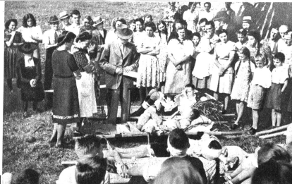
Rechts: Ein besonders schwieriger Fall wird eingehend besprochen