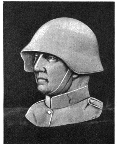
Das am 11. und 12. Dezember zum Verkauf gelangende Abzeichen als Stecknadel

Auch dieses Jahr ist deshalb wieder eine Soldatenbescherung vorgesehen. Das Weihnachtspäcklein aus freiwilligen Geldern des Schweizervolkes finanziert, ist eine symbolische Gabe der Dankbarkeit. Der Wehrmann im Felde weiss dieses Geschenk zu schätzen. Es bereitet viel Freude und schafft gegenseitiges Vertrauen. Die Gewissheit, für ein dankbares