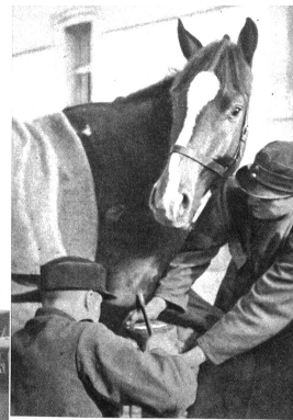
Oben: Nachdem das Hufeisen gut angepasst ist, wird es mit sieben bis acht Nägeln auf der Hornkapsel befestigt, ohne dass der „lebende“ Teil des Hufes berührt werden darf. Der „Bless“ selbst schaut der Arbeit neugierig zu