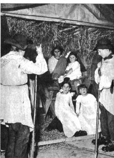
Hirten bei der Krippe