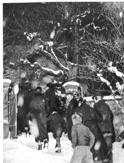
Eine richtige kalte Winternacht ist heute, mit Schnee und Biswind. Aber das hindert die Sigriswiler nicht, am Weihnachtsspiel in der Kirche teilzunehmen. Von weit kommen sie zur gemeinsamen Feier