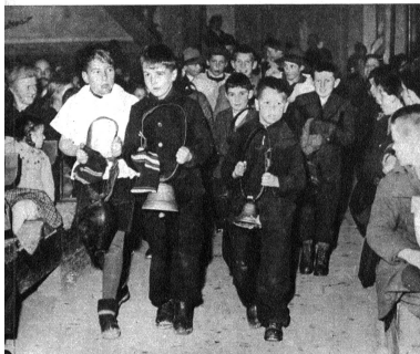
Unter dem Brausen der Orgel kommen zuerst die Buben durch den Mittelgang, voran die „Lüterbuebe“ mit dem „Chüjergüsi“ und hinter ihnen die Herten