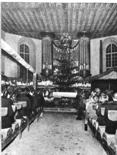
Blick in den Chor der Kirche während der Feier