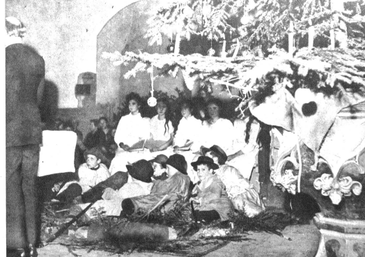
Links: Da ist eigens für das Weihnachtsspiel der „Stall von Bethlehem“ gebaut worden. Der Herr Pfarrer prüft selbst die Beleuchtung, während Frau Pfarrer die Krippe zurecht rückt. Oben: Der Pfarrer ist zur Begrüssung und Gebet an den Tisch getreten. Rechts neben ihm das Hirtenfeld, dahinter die Englein. Dar aus dem 15. Jahrhundert stammende prächtige Taufstein mit dem Christbaum

sie sich der Krippe, um das Christuskind zu grüssen.