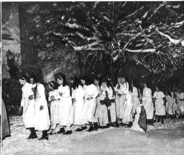
Dann ist die Reihe an den Mädchen. Sie kommen über den Friezhof vom Pfarrhaus her. Englein gleich, ganz in weiss gekleidet