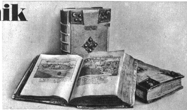
Die drei Handschrift-Folianten der Stadtbibliothek Bern

« Die Geschichte ist die Lehrmeisterin der Völker », so weisst es ein oft zitiertes Spruch. Der nämlichen Auffassung huldigt auch Diebold Schilling. Seine Berner Chronik hat ausgesprochen lehrenden, erzieherischen Charakter. Er flicht in seine bald knappe, bald behaglich plaudernde Darstellung allerhand erbauliche Nutzenwendungen ein. Die Bewegungen sich freilich im engen Rahmen landläufiger, etwas primitiver Lebensweisheit und Staatsklugheit ohne gewagte-verblüffende Abstraktionen und grossen Gedankenflug; dafür ist ihnen ein anerkennenswerter Freimuth eigen.