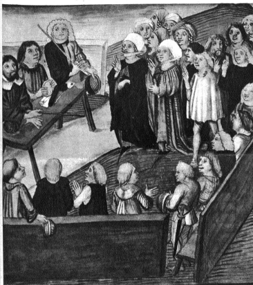
Aus dem Tvingherrenstreit: Bubenbergs Mutter und Gattin vor Gericht

Der Text der Berner Chronik Diebold Schillings ist seit bald 50 Jahren allgemein zugänglich; Gustav Tobler hat ihn 1897 im Auftrag des Historischen Vereins herausgegeben und mit allen für die wissenschaftliche Auswertung dienlichen und wünschbaren Erläuterungen versehen. Allein dieser verdienstlichen Publikation fehlen die (über 600) Bilder, mit denen Schilling sein Werk schmückte und die eine wertvolle Fundgrube für die Kulturgeschichte darstellen.