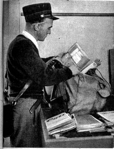
Unten im Tal liegt die Ortschaft Malleroy, wo unser „Pösteler“ Tag für Tag seine Post zu holen hat. Nichts darf für den nächsten Tag bleiben, wie all die Sachen mitgenommen werden können.