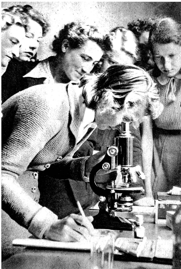
Arbeit am Mikroskop