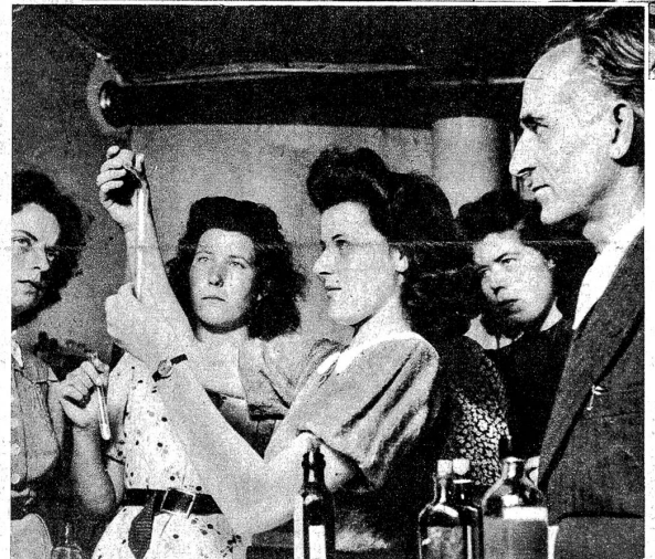
Schülerinnen bei einer Reagenzprobe

mancher Arzt verwendet in vermehrtem Masse verschiedene Bestrahlungen oder andere physikalische Therapien an, und viele Aerzte führen täglich kleine chirurgische Eingriffe an Verunfallten oder Kranken aus.