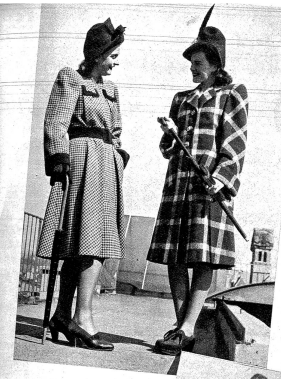
Sportmäntel aus der Frühjahrskollektion der Firma Rüfenacht & Heuberger AG. Bern