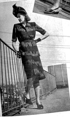
Elegantes Deux-pièces, schwarz-gelb mit originellem Druckmuster. Modell Rüfenacht & Heuberger