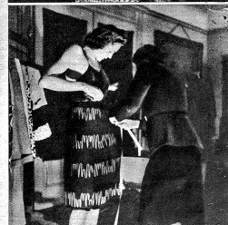
Vor der Modeschau wird jedes Modell auf den Mannequin angepasst

Grossmusterles, sehr schön, reichlich wirkendes Sommerkleid. Das Blumenmuster in lebhafte Farben wirkt besonders apart auf dem hellen Grunde. — Modell Rüfenacht & Heuberger