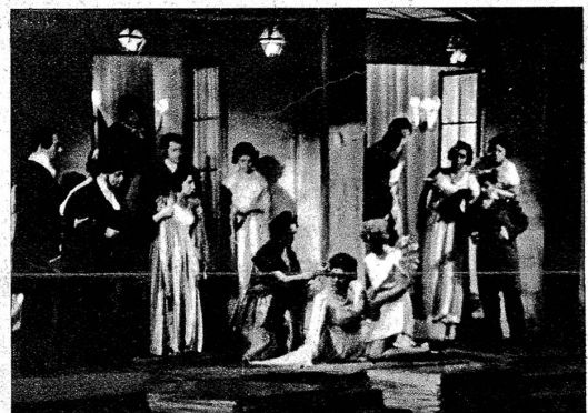
Simone fällt beim Anblick seiner Untreue in Ohnmacht; das Fest bricht jäh ab

Mit diesem bedeutenden Werk des Schweizer Komponisten hat das Stadttheater seinen ersten Beitrag zur „Schweizer Kunst in Bern“ herausgebracht. Diese Oper aus dem Jahre 1919 nimmt in Schoecks Operschaffen einen ersten Rang ein; sie ist das leidenschaftliche Bekenntnis einer Künstlerseele, die, in der Inbrunst der Schönheit befangen, das wirkliche Leben vergisst und sich in dieser Todesliebe verzehrt