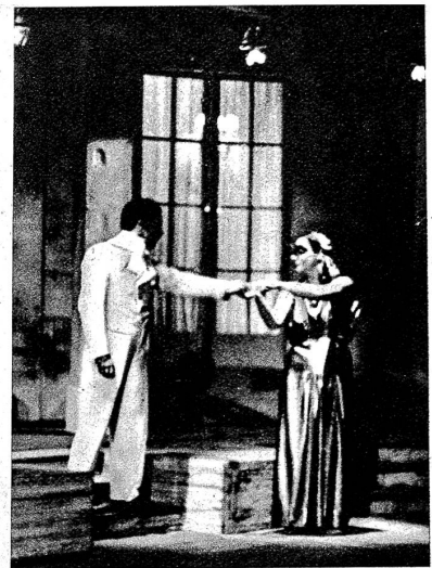
Am Abend erscheint am Fest eine Unbekannte. Horace folgt ihr und steckt ihr liebestrunken seinen Trauring an den Finger. Sie demaskiert sich: Es ist die Venus, und Horace küsst sie